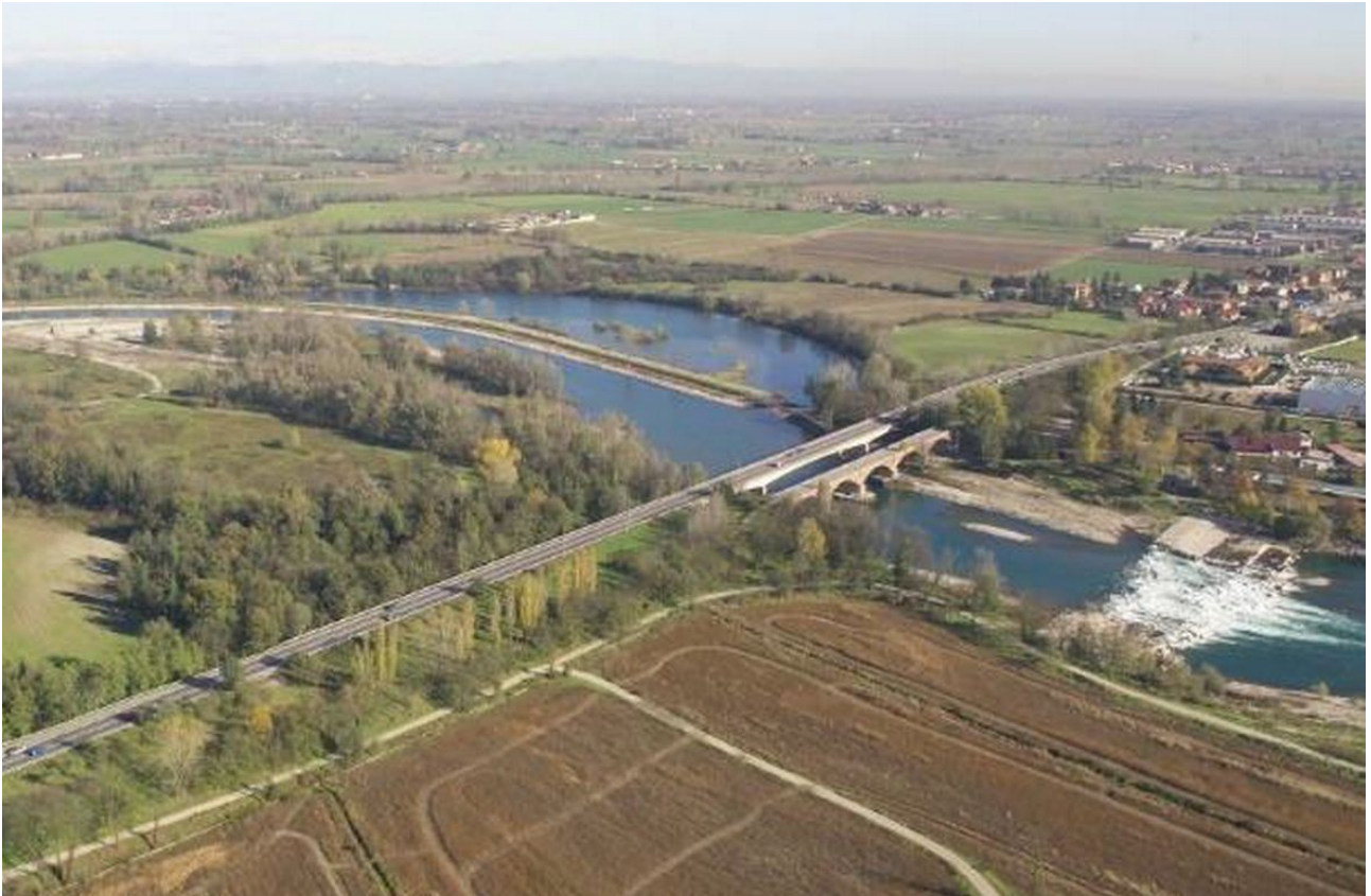
Tratto interessato dai lavori

La Provincia di Cremona spinge l’acceleratore, approva il linea tecnica il progetto definitivo con l’intento di avviare quanto prima i lavori di riqualificazione del tratto di Paullese nei comuni di Spino e Zelo Buon Persico della lunghezza di 1,5 Km. I lavori consistono nel raddoppio del sedime stradale e del ponte sull’Adda con il fine di aumentare la sicurezza e la fluidità del traffico esistente sull’arteria. E’ inoltre prevista la ristrutturazione del vicino ponte Asburgico, il quale verrà consolidato e destinato al transito dei mezzi agricoli e quale percorso ciclo-pedonale.