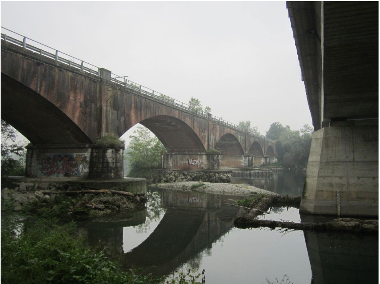
situazione attuale tra il ponte stradale della SP ex SS 415 e il ponte Asburgico