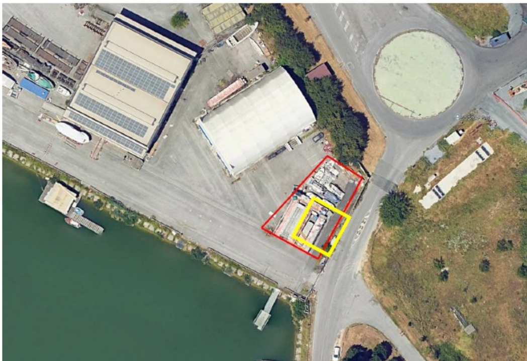
(fig. 2 ampliamento area B)